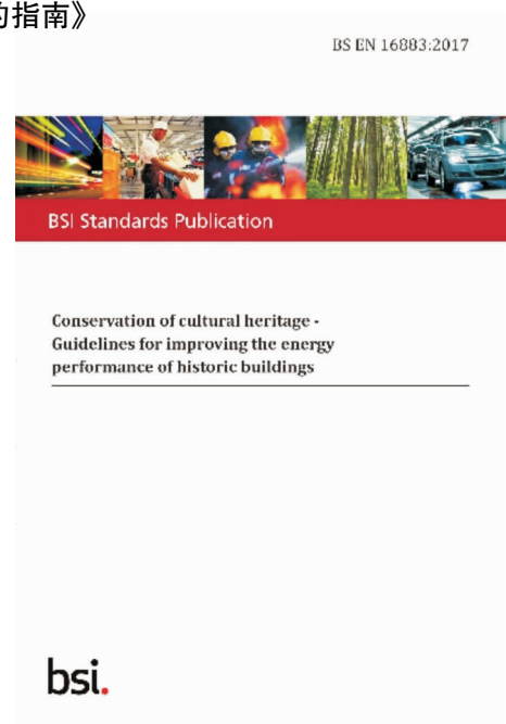
图1 《BS EN 16883:2017 文化遗产保护——改善历史建筑能效的指南》封面 [8]

在《指南2017》总则其中的“建筑保护原则”(Principles of building conservation)部分强调每座历史建筑都应被视为特例,因此在进行决策前进行充分的研究和记录非常重要.需要了解建筑物的真实性、完整