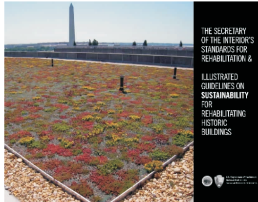
图4 《美国内政部修复标准与关于可持续性历史建筑修复的图解准则》封面 [6]

For Preserving, Rehabilitating, Restoring & Reconstructing Historic Buildings ). 其中的第二章节《历史建筑物更新标准及更新准则》(Standards For Rehabilitation & Guidelines For Rehabilitating Historic Buildings)下的单独分册便是本文所介绍的《内政部历史建筑更新标准与可持续性更新的图解准则》( The Secretary of the Interior's Standards for Rehabilitation & Illustrated Guidelines on Sustainability for Rehabilitating Historic Buildings )(见图7).